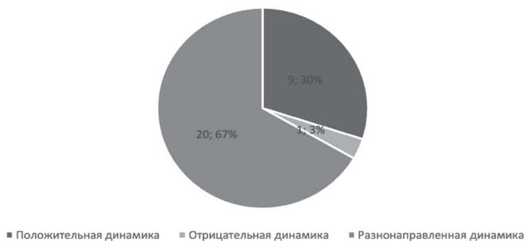
Рис. 1. Динамика параметра оценочности ядерных единиц русского ЯС.

Разнонаправленная динамика параметра оценочности в зависимости от возраста испытуемых наблюдается в ассоциативных полях двадцати ядерных единиц, таких как человек, идти, мальчик, сильный, море, школа, работа, радость, смерть, мир, красный, грязь, старый, девушка, город, ум, стол, свет, глупый, время .