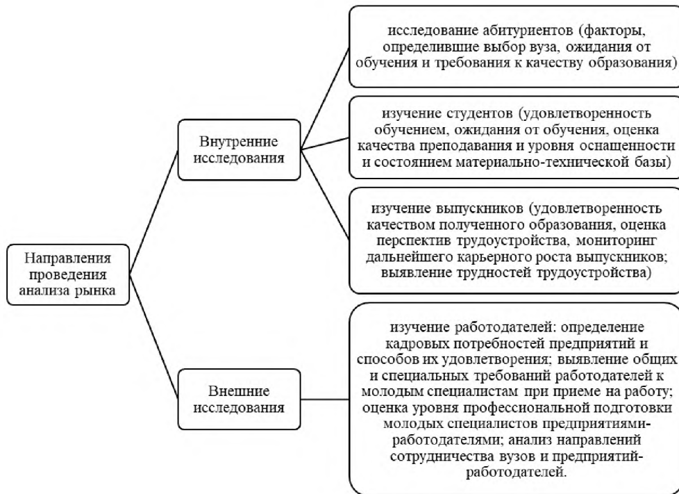
Рис. 3. Направления проведения анализа рынка с целью формирования стратегии содействия трудоустройству выпускников вузов

Следовательно, целью проведения анализа рынка с целью формирования стратегии содействия трудоустройству выпускников вузов, является удовлетворение интересов всех групп пользователей образовательных услуг, которые представлены абитуриентами, студентами, выпускниками организациями-работодателями, а не только собственниками вуза.