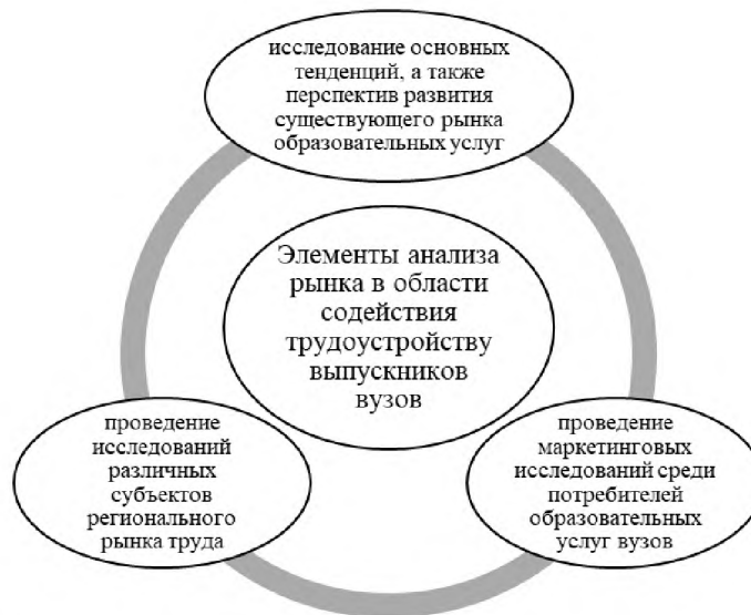
Рис. 2. Элементы анализа рынка в рамках формирования стратегии содействия трудоустройству выпускников вузов