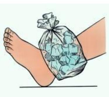
Рис. 6.1. Полиэтиленовый пакет со льдом, наложенный на голеностопный сустав при растяжении связок

Первая помощь. При растяжении, разрыве связок поврежденному суставу прежде всего необходимо обеспечить покой, наложить тугую повязку и для уменьшения боли прикладывать холодный компресс (рис. 6.1.) на протяжении 12-24 часов, затем перейти на тепло и согревающие компрессы.