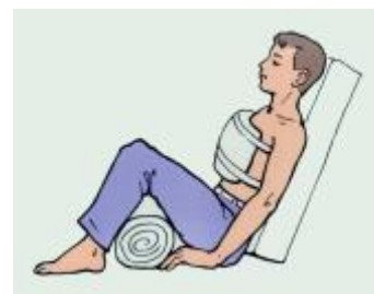
Рис. 6.3. Иммобилизация пострадавшего при ранении в грудь.

Пострадавшего нужно как можно быстрее доставить в лечебное учреждение. Предварительно необходимо обеспечить надежную транспортную иммобилизацию, а при открытом переломе еще и наложить на рану стерильную повязку. В случае сильного кровотечения необходимо